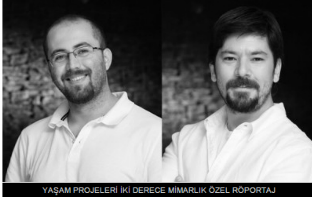
YAŞAM PROJELERİ İKİ DERECE MİMARLIK ÖZEL RÖPORTAJ