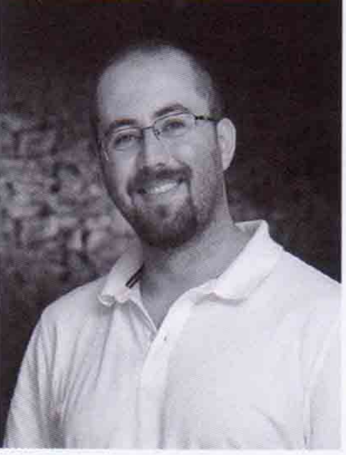
Erkan Erarlan İki Derece Mimarlık